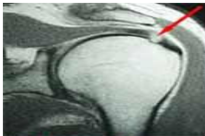
پارگی روتاتور کاف مرکز جامع توانبخشی امید

توانبخشی: توانبخشی شامل استفاده از مدالیتیه های مختلف فیزیوتراپی، لیزر درمانی، دیاترمی و تمرین درمانی است. این روش درمانی به کاهش علائم و تقویت عضلات اطراف کمر بند شانه ای کمک می کند و مدت زمان زیادی هم میطلبد.